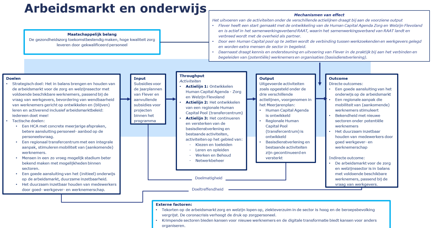
Figuur 3. Beleidstheorie achter het programma Arbeidsmarkt en Onderwijs .

Onder de derde actielijn vallen weer vier thema's of programmaliijnen: (1) Kiezen en Toeleden (later veranderd in Instream ), (2) Leren en Opleiden , (3) Werken en Behoud , en (4) Netwerkbeheer . De drie actielijnen (zie 'throughput') moeten bijdragen aan balans van de arbeidsmarkt voor de zorg- en welzijnssector (zie 'doelen'). In Figuur 3 is de beleidstheorie achter het programma Versterken van Inwoners weergegeven, en in Tabel 3 zijn de beoogde activiteiten uitgelegd.